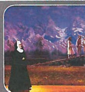
La puesta en escena es espectacular con 22 cambios de escenario.