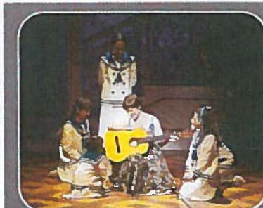
Los niños son elegidos en cada ciudad donde se representa la obra.

Reconoce que sale de cada función vacía, después de haberlo entregado todo sobre el escenario, pero llena de otras emociones y sentimientos que le aporta la obra. Su ilusión es que el público viva la misma experiencia y que salga del teatro «lleno de amor y de ganas de cantar».